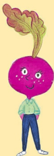
Rike Rote Beete