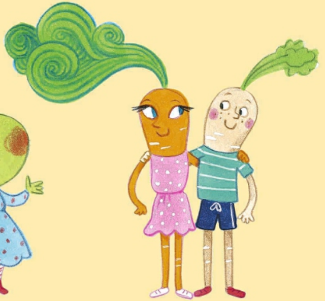
Kira Karotte und Basti Pastinake