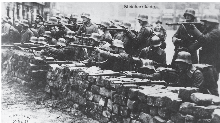
Straßenkämpfe in Berlin während des Generalstreiks (1919)

Und die Berliner? Die sind zwar verunsichert, aber vor allem froh, dass sie bis hierhin überlebt haben: den Krieg, den Hunger, das Elend. Die Enge und Dunkelheit in den Zigtausend miserablen Wohnungen treiben die Menschen vor die Tür, zu Hause fällt ihnen die Decke auf den Kopf. Voller Lebenshunger stürzen sich vor allem die vielen jungen Menschen auf das, was ihnen die Millionenstadt in Kneipen, Bars und auf Straßen und Plätzen zu bieten hat. Die alten wilhelminischen Moralvorstellungen schmeißen sie mit Wonne über Bord.