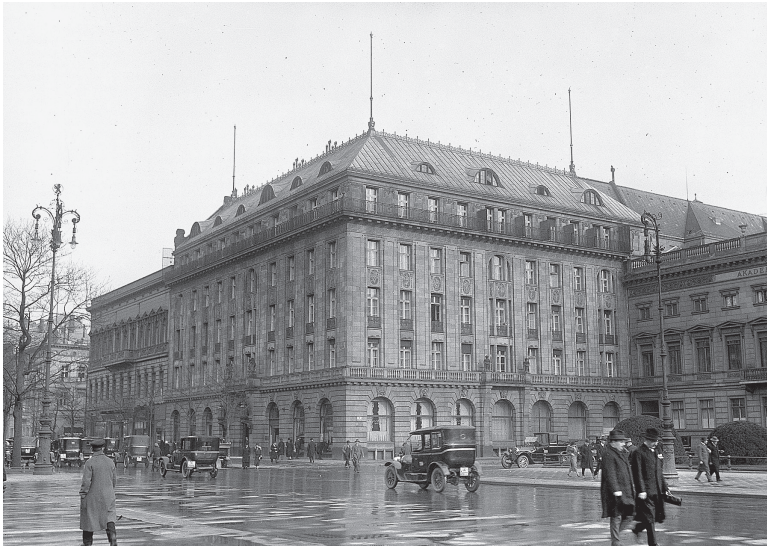
Das Hotel Adlon am Pariser Platz (Aufnahme aus den zwanziger Jahren)

dem Titel »Hotel Adlon«, in dem sie die großen und kleinen Vorfälle aus dem Alltag des Hotels detailliert beschreibt, Klatsch und Tratsch inklusive. Auch die Entdeckung eines Mordfalls gleich am zweiten Tag des neuen Jahres 1919 erlebt sie hautnah mit.