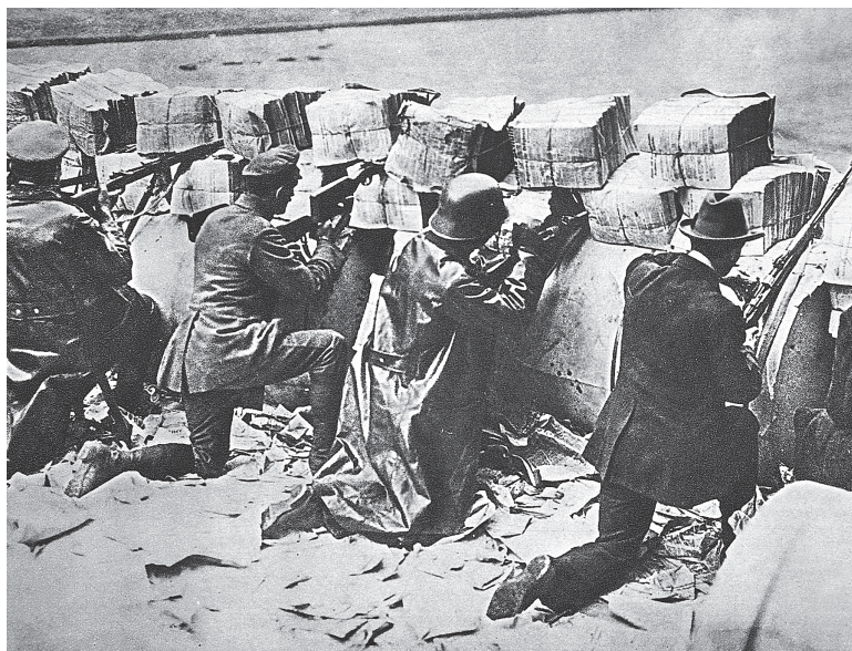
Im Berliner Zeitungsviertel verbarrikadieren sich Spartakisten hinter Zeitungsstapeln (Januar 1919).