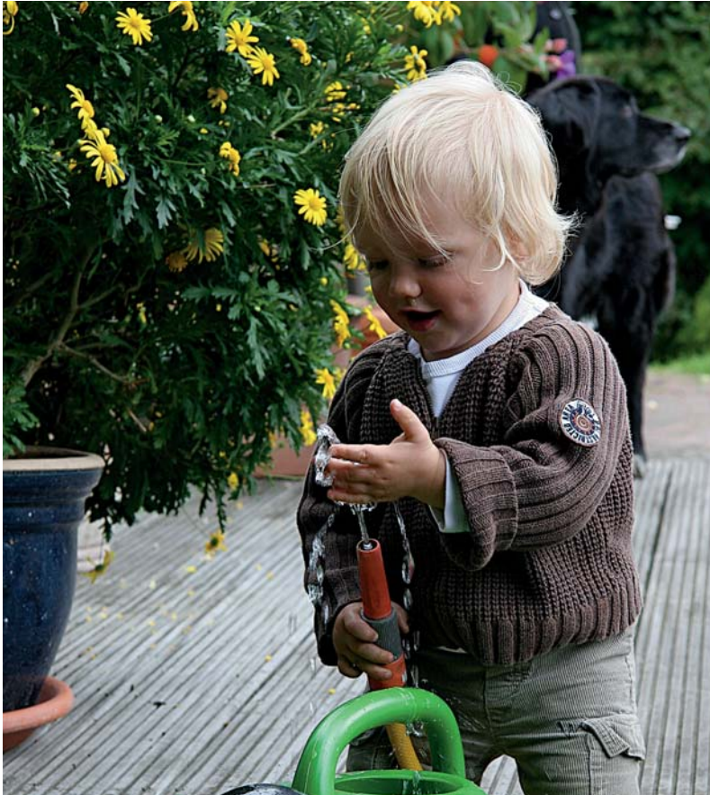
Mit allen Sinnen die Welt begreifen

aufnehmen, im Kopf verarbeiten und eben nicht mit allen Sinnen erfassen kann. Bereits das Schreiben des Buches ist ein einseitiger Akt.