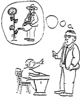
Abb. 4: Gärtner