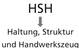
Abb. 1: HSH = Haltung, Struktur und Handwerkszeug

In diesem Buch möchte ich darauf achten, dass die Ziele mit den Methoden kongruent sind. Was bedeutet das? Wir alle erleben im öffentlichen Raum immer wieder Menschen, die heimlich Wein trinken, während sie öffentlich Wasser predigen, wie Heinrich Heine es pointiert formuliert hat. 4 Wer beispielsweise als