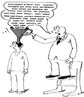
Abb. 2: Nürnberger Trichter

Eine Lehrerin, die einem Schüler gegenübersteht, kann sehr unterschiedliche Vorstellungen von diesem Schüler haben. Diese Vorstellungen sollen hier als Metaphern ausgedrückt werden: Sie kann ihn beispielsweise als Gefäß betrachten, in das wie mit einem Nürnberger Trichter Wissen eingegeben wird; sie kann das Kind als Blume sehen, die es zu gießen gilt, damit sie wächst; sie kann auch das Kind als Marionette und sich selbst als Marionettenspielerin betrachten; ebenfalls kann das Kind ein zu zähmendes Raubtier sein, dem die Lehrerin als Dompteur gegenübersteht.