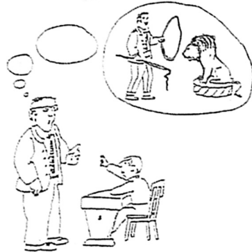
Abb. 5: Dompteur

Jede dieser Metaphern ist weder richtig noch falsch, sondern bei verschiedenen Menschen einfach vorhanden. 6 Eine Lehrperson, die ein Kind eher als Blume und sich als Gärtner betrachtet, wird andere Umgangsweisen und Kommunikationsmittel, andere Methoden, andere didaktische Modelle, andere Sanktionen entwerfen als jemand, der das Kind als leeres Gefäß betrachtet, das es mit Wissen zu füllen gilt.