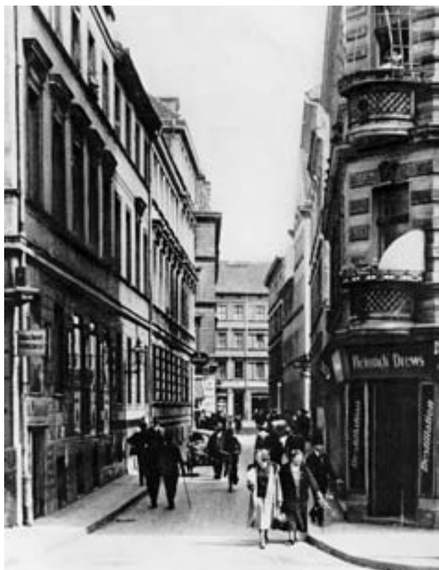
Die Schendelgasse – hier ein Photo aus dem Jahr 1935 – bildete den Eingang zum damals noch überwiegend jüdisch geprägten Scheunenviertel