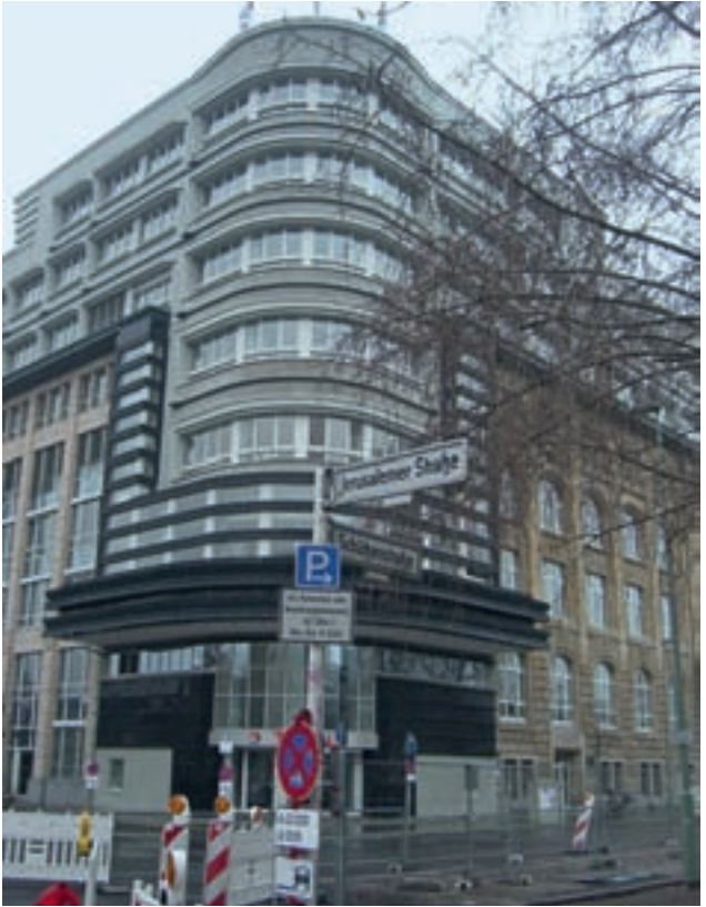
Das Verlagshaus von Rudolf Mosse in der Jerusalemstraße war Arbeitsstätte von Kurt Tucholsky, Egon Erwin Kisch und Co.