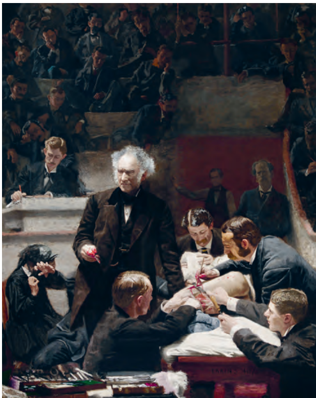
Abb. 2: Thomas Eakins, The Gross Clinic (1875)